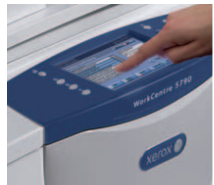
Gepersonaliseerde oplossingen direct toegankelijk vanaf het aanraakscherm.

ScanFlowStore software van Nuance® verkort de verwerkingstijd van documenten aanzienlijk met krachtige technologie voor optische tekstherkenning (OCR). Met het scannen van sjablonen kiest een gebruiker bepaalde "zones" in een document om daar specifieke gegevens te verzamelen, bijvoorbeeld medische, juridische of financiële, om die te gebruiken voor de naamgeving van bestanden of netwerkmappen, PDF-eigenschappen, zoeken en opvragen en om gescande documenten in de juiste archieven op te slaan.